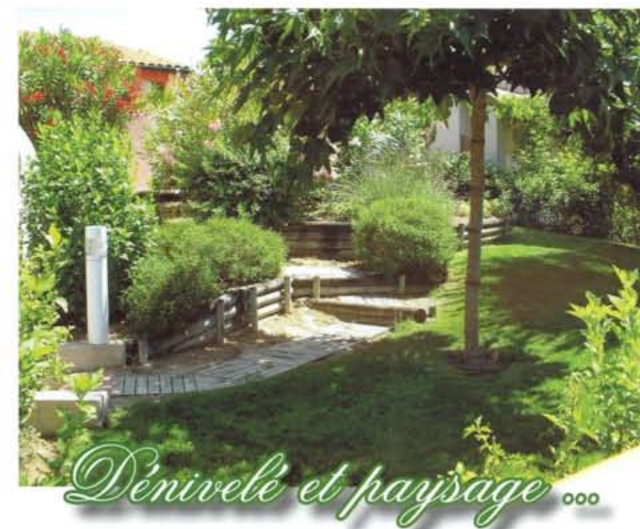
Dénivelé et paysage 000