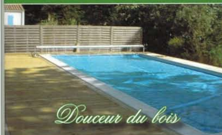
Douceur du bois