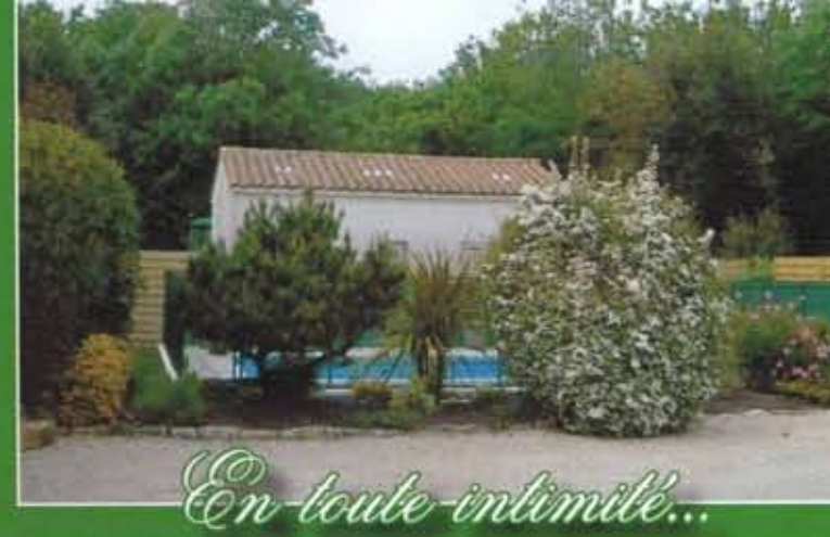
En toute intimité...