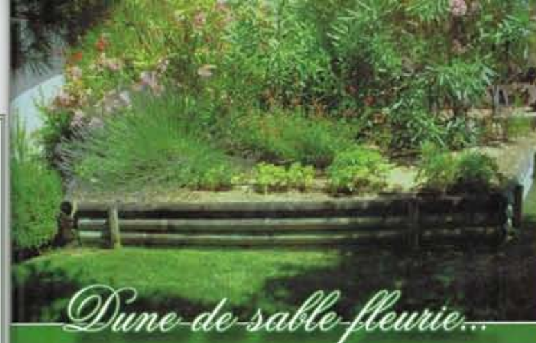
Dune de sable fleurie...