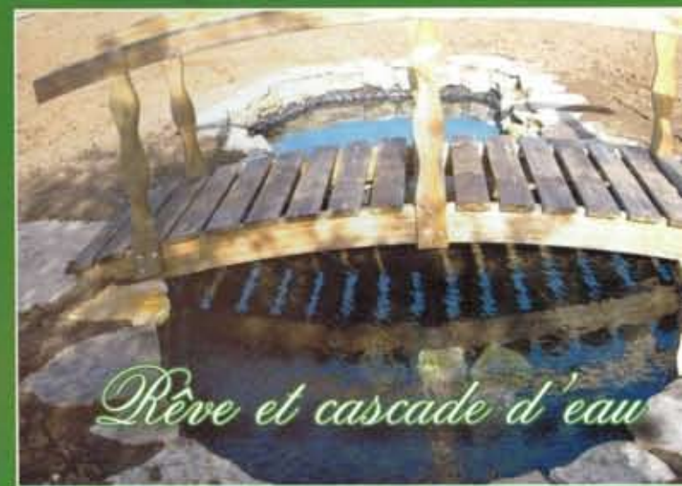
Rêve et cascade d'eau