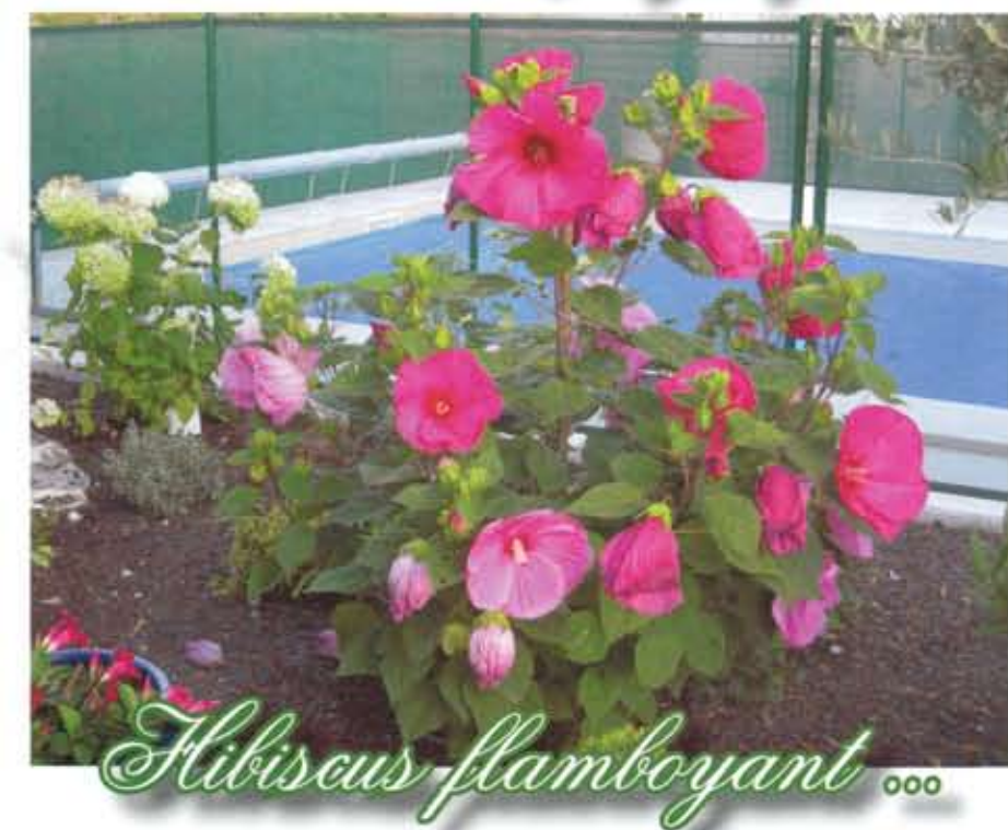
Hibiscus flamboyant 000

V oici une des phrases que Serge Maze clame haut et fort.