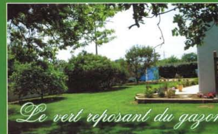
Le vert reposant du gazon